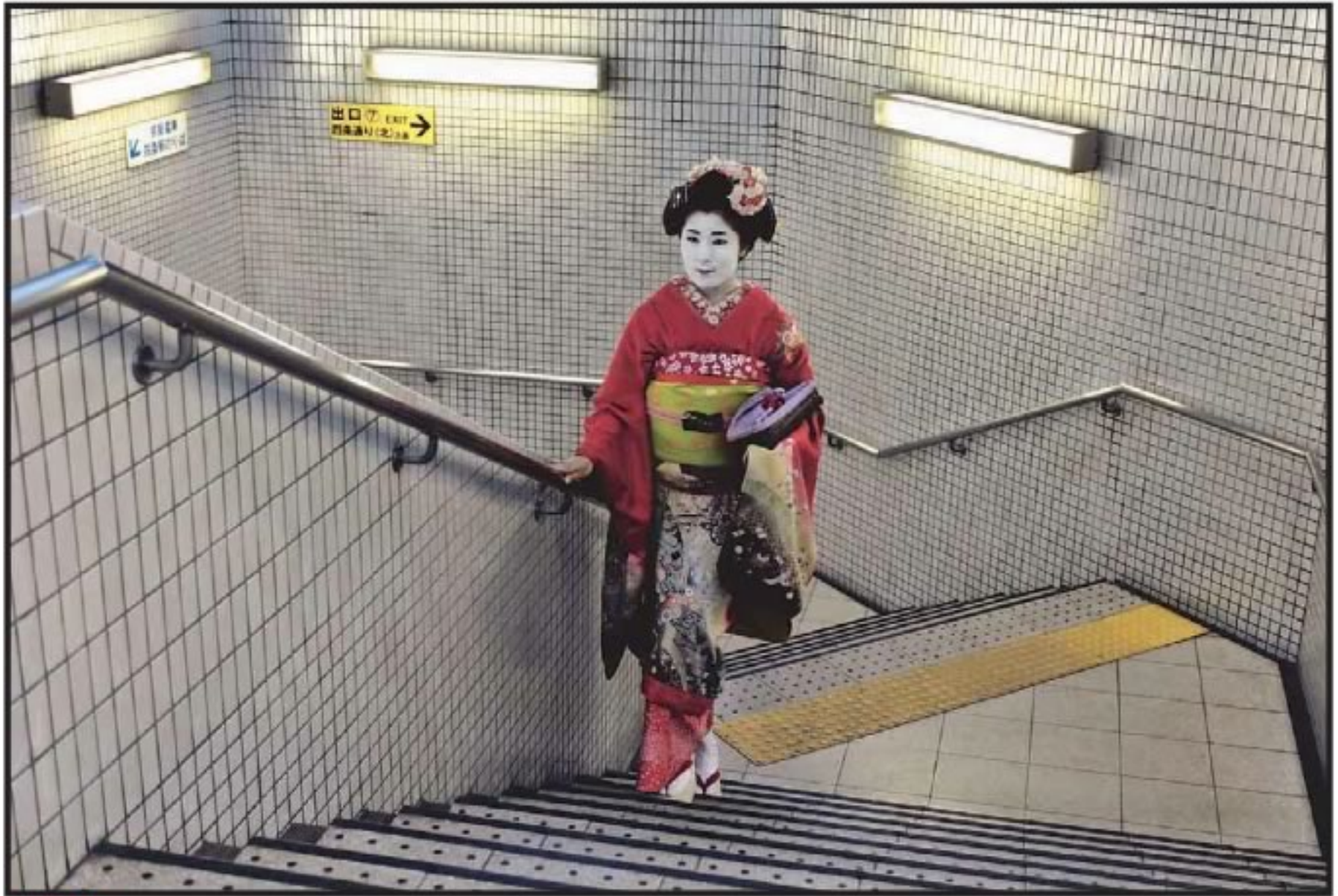
TRADICIÓN VIVA Una geisha sube las escaleras del subte en Kyoto, Japón (2007).