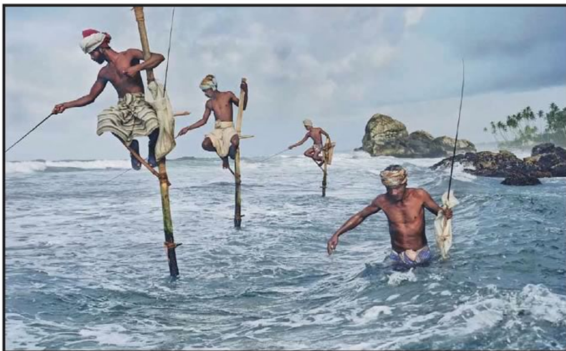
TANTOS MUNDOS EN EL MUNDO Pescadores en la costa meridional de Weligama (1995). Ejemplo de una de sus máximas: “La fotografía no tiene guiones, no se planifica”.

Trabaja con cámaras Nikon y Hasselblad y forma parte de la exclusiva agencia Magnum, la cooperativa fotográfica mundial donde fichan las mejores lentes del siglo XX y XXI, desde 1986. Documentó conflictos mundiales, como la guerra del Golfo, Irán-Irak, la desintegración de Yugoslavia