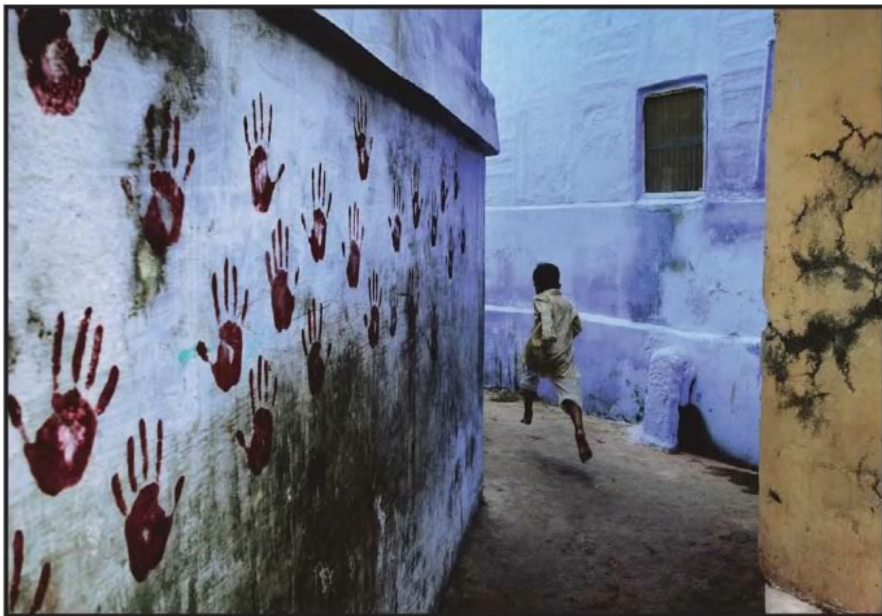
EN MOVIMIENTO Niño en medio de una fuga en Jodhpur, India (2009). Desde 1980, McCurry ha realizado más de 75 travesías por India, Nepal, Pakistán, Afganistán y Tíbet, poniendo sus conflictos en imagen.

y el 11 de septiembre. “El fotógrafo que va a la guerra, a Haití o al tsunami, siente emoción y tristeza porque hay mucho dolor alrededor, hay gente que ha perdido partes del cuerpo, gente muriendo... Cuando uno ve este tipo de muerte y destrucción tiene que encontrar una fortaleza interna que permita seguir con la vida, con el día a día de la profesión y no colapsar”, explica McCurry. Sus trabajos recibieron varios reconocimientos, entre ellos cuatro primeros premios en el concurso anual de World Press Photo y el Oliver Rebbot Memorial Award.